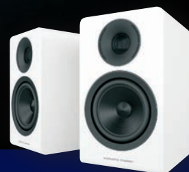
Acoustic Energy staroanglické dvoupásmovky

Test: Multimediální centra • Osobní audio přehrávače High Fidelity: 440 Audio, Burmester, KEF, Reed, Spondor, TEAC Kdo s koho: Streamovací reprosystemy