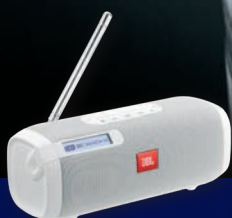
JBL tranzistorákův vnuk